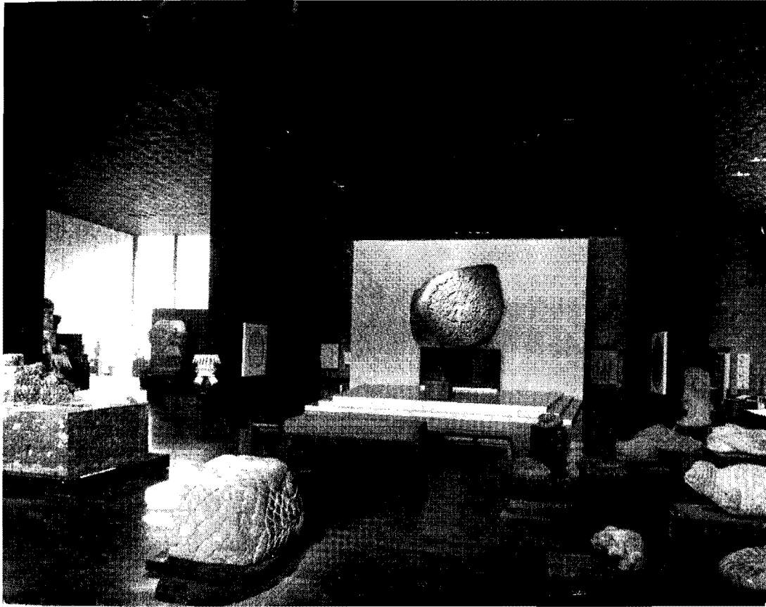
Figura 1. La nave central de la Sala Mexica.