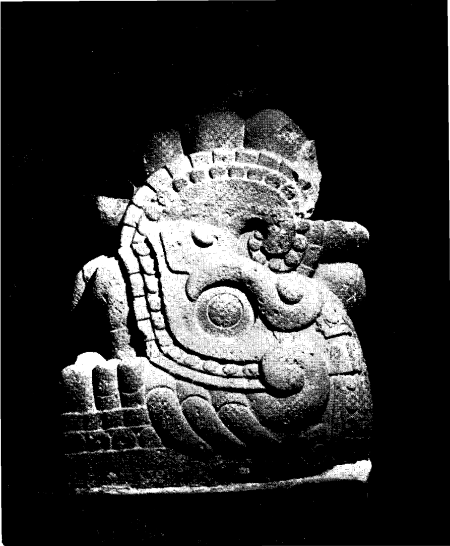
Figura 3. La monumental Xiuhtecuātl.