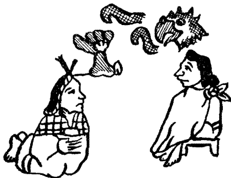
Figura 3. Matrimonio de Cuauhtlatoa y Tepexochilama. Historia Tolteca Chichimeca , lámina xxv.

Tlacatéotl, en sus numerosos enlaces, "procreó muchísimos hidalgos". Seguramente por esto nos ha dejado un verdadero problema para aclarar la personalidad de su sucesor.