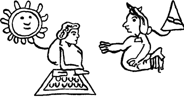
Figura 2. Matrimonio de Tlacatéotl y Tetzcocacihuatzin. Códice Xólotl , lámina v.

del segundo soberano se cuidó mucho. Así pues, su matrimonio fue concertado políticamente.