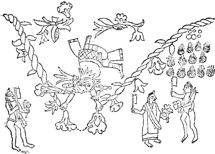
Fig. 4. Códice Vaticano A : Sol de Tierra.