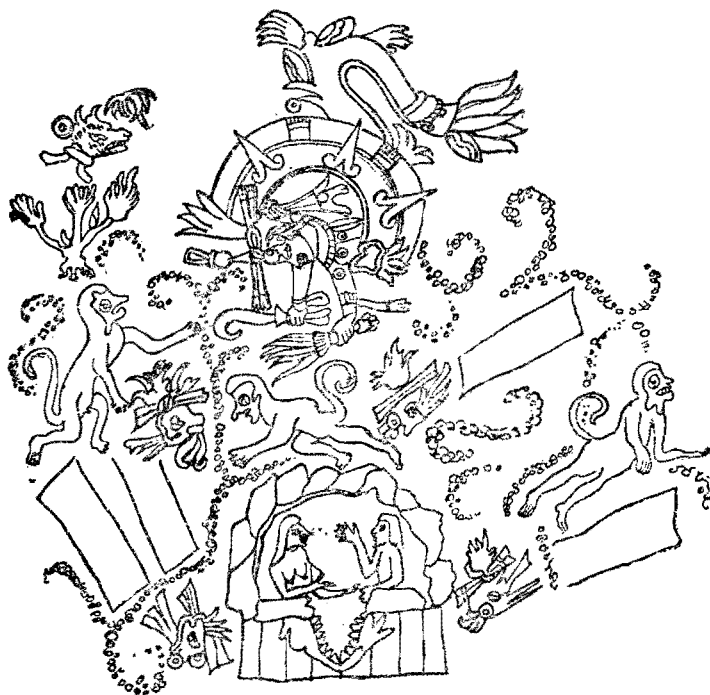
Fig. 2. Códice Vaticano A : Sol de Viento.